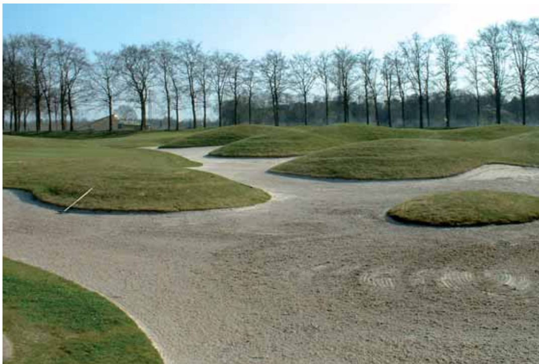
Goyer GOC, Nederland

Het is de taak van de golfbaanarchitect, om goed te weten wie de klant is en wat hij wil. Wie de spelers zijn die erop zullen spelen. Het heeft geen zin om een "carry" te forceren van honderden meters, vol met bunkers, en de modale speler de indruk te geven dat hij hier de rest van zijn leven gaat doorbrengen, waar de betere speler enkel de green in het oog heeft.