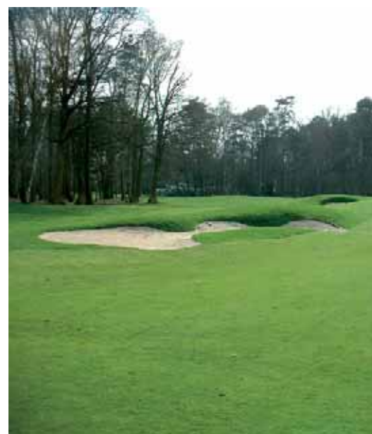
Royal Golf Antwerp GC, België

Het doel, tenslotte, is om de juiste balans te vinden tussen aantal en de esthetiek. Om de betere speler te belonen, zonder de minder begaafde speler af te straffen. Een golfarchitect moet een baan aantrekkelijk maken voor het oog van alle spelers, of deze nu jong of oud, goed of slecht zijn. Verscheidenheid en afwisseling is de sleutel voor succes.