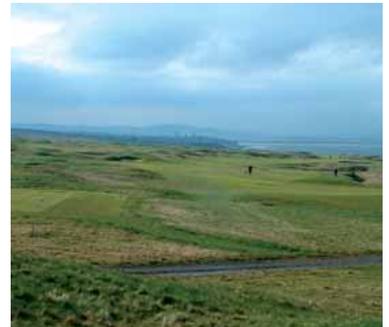
St Andrews bay

De moeilijkheidsgraad van een bunker wordt bepaald door de onstabiele ondergrond, de verschillende dieptes, zandsoorten en het feit dat de club niet op het zand geplaatst mag worden. Voor de modale speler is de bunker veel moeilijker dan voor de gevorderde speler. De betere speler kan een beter contact maken met de bal, komende uit een bunker, en meer effect geven, dan de minder goede speler.